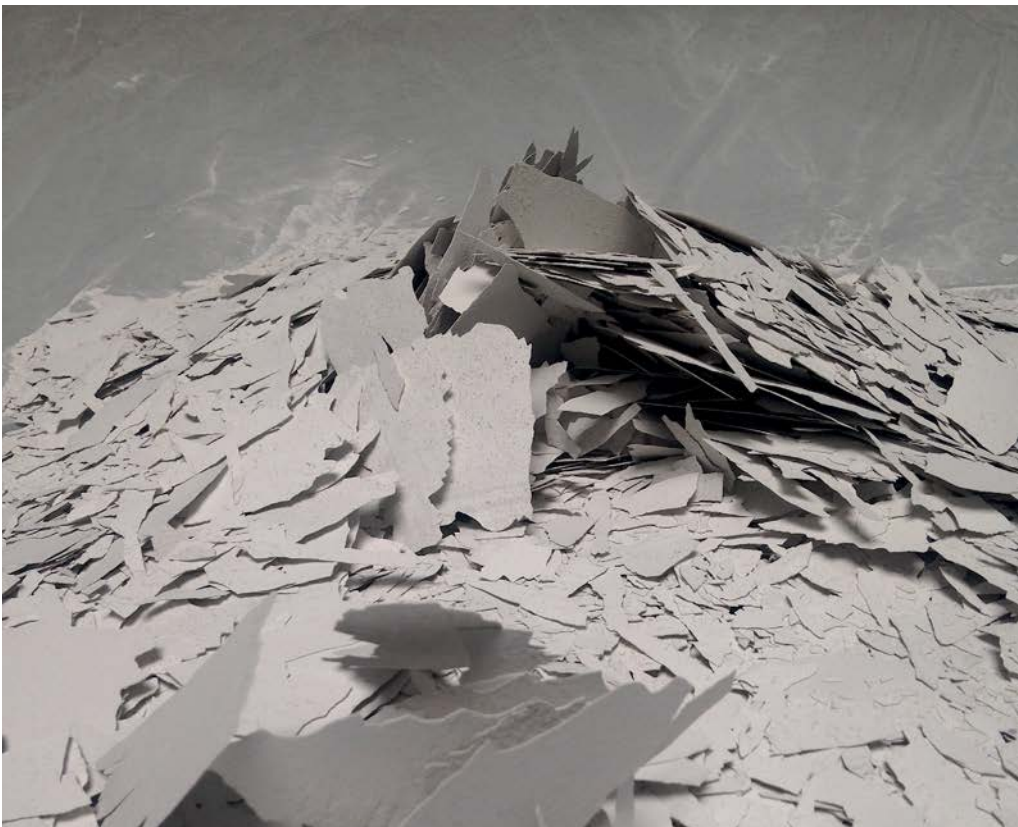
Ligne brisée (détail) © Lise Couzinier 2015